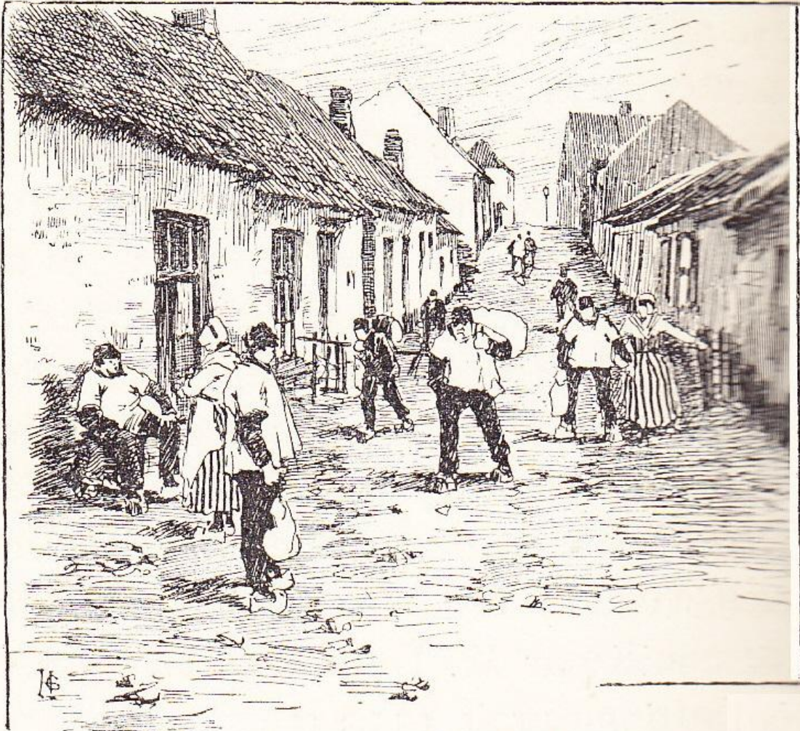
La rue de la Crevette, à Heyst.